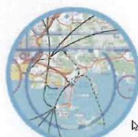
Réglementation, navigation et sécurité

Valorisation dossier parcoursup Service de l'enseignement supérieur