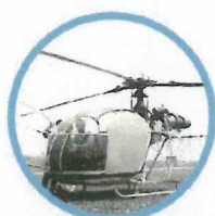
Histoire et culture de l'aéronautique et du spatial