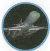
Aérodynamique et mécanique du vol