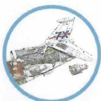
Etude des aéronefs et des engins spatiaux